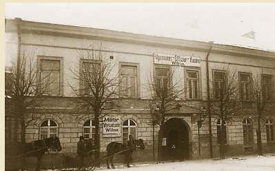
Oskierkų rūmai. Pastatas, kuriame 1785–1796 m. vaidino pirmoji Vilniaus miesto teatro trupė (neišlikęs). 1944 m. (fasadas į dab. Klaipėdos g. vė).